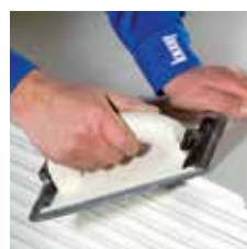
Kartonrand 'breken' met schuurgaas