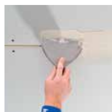
Voegmortel in de voeg drukken en dun opzetten op het plaatoppervlak