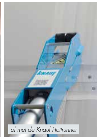
of met de Knauf Flotrunner

2 Befestig zelfklevend wapeningsgaas over de naden. In plaats van wapeningsgaas kan ook een papierstrook of glasvezel voegenband worden gebruikt.