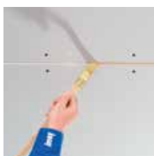
Kanten gronderen met Knauf Diepgrond