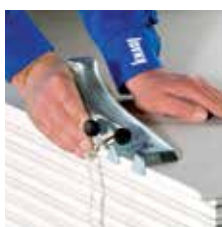
Aanbrengen van een facetkant met de facetschaaf