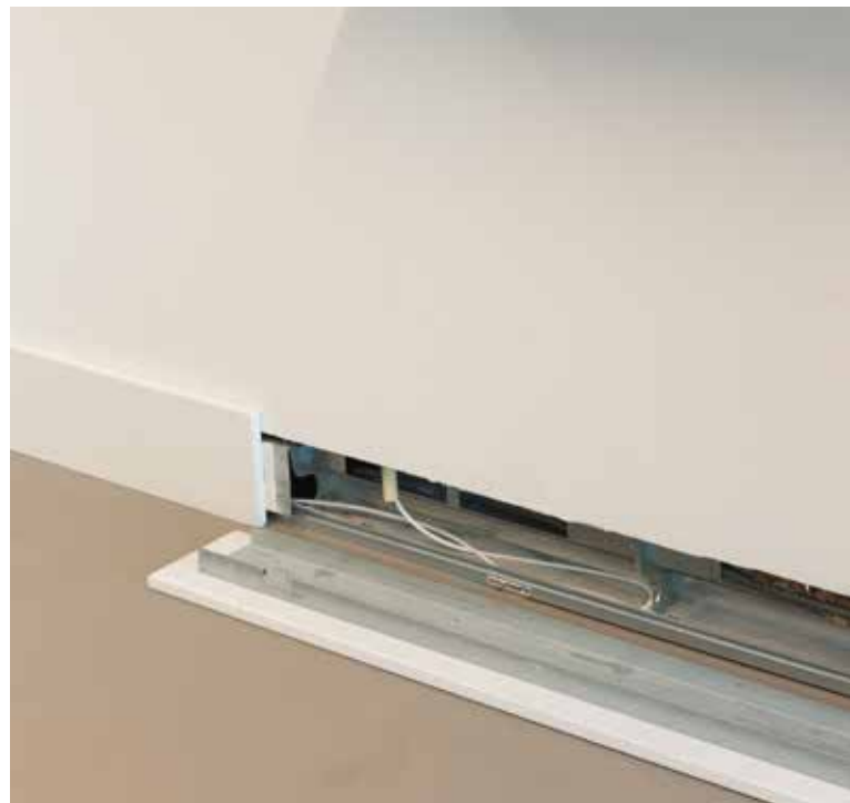
Slimme plint biedt flexibele toegang tot elke installatie

De kracht van Knauf BoWall komt vooral tot uiting bij aanpassingen aan de installatie. Omdat de wand eenvoudig en blijvend bereikbaar is na oplevering, kunnen aanpassingen snel en zonder veel hak-, breek- en herstelwerk uitgevoerd worden. Dit kan tot ruim 50% besparing opleveren.