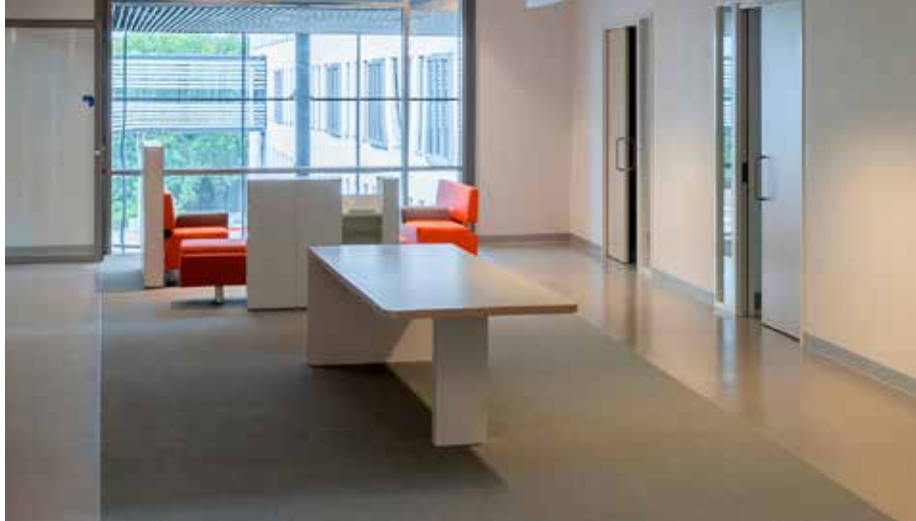
Meander Medisch Centrum - Amersfoort